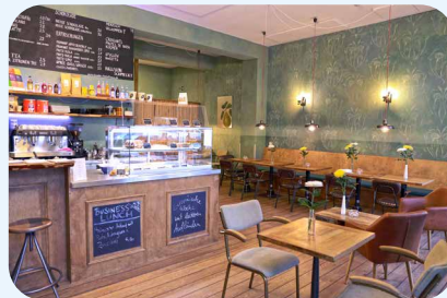
Das Café Sterntal in der Rheinstraße 10

Wir haben in diesem Heft etwas versteckt. Es ist ein kleiner Marienkäfer. Das ist ein kleines, rotes Insekt mit schwarzen Punkten auf den Flügeln. Habt Ihr ihn schon entdeckt? Schaut genau hin!